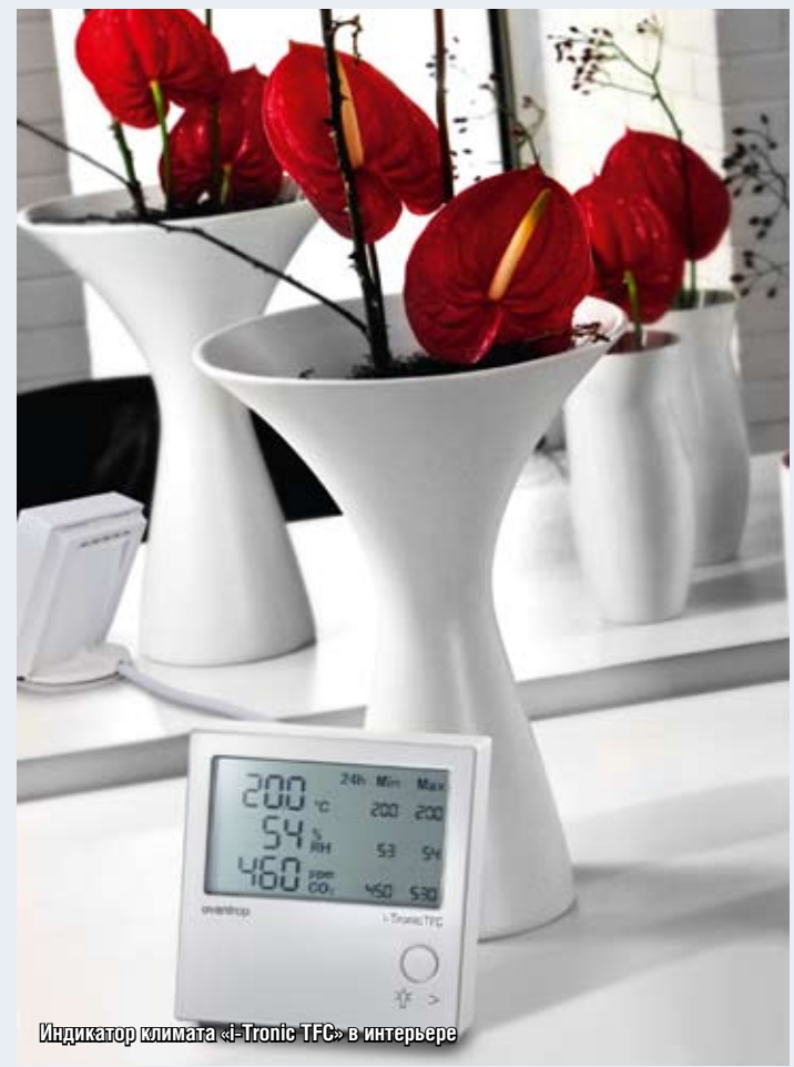
Индикатор климата «i-Tronic TFC» в интерьере

Прибор-индикатор климата «i-Tronic» служит для измерения и контроля важнейших климатических параметров: