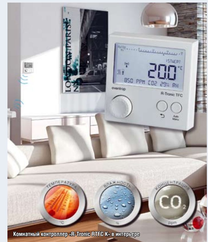
Комнатный контроллер «R-Tronic RTFC К» в интерьере