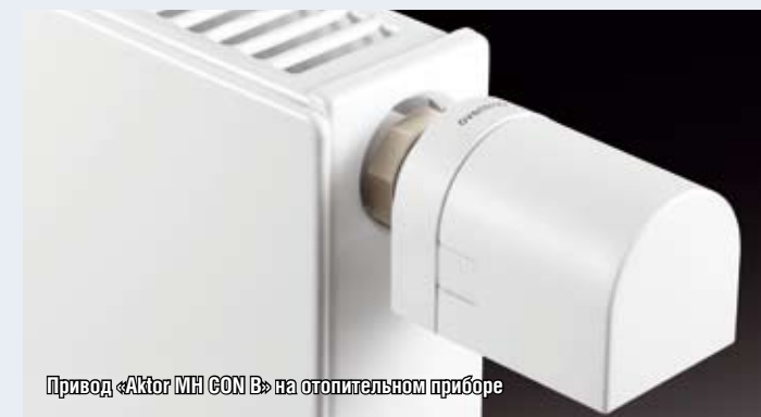
Привод «Актор МН CON В» на отопительном приборе